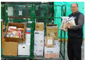
川崎労働者福祉協議会 様