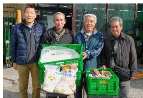
立正佼成会 横浜教会 様