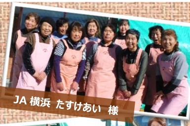
JA 横浜 たすけあい 様