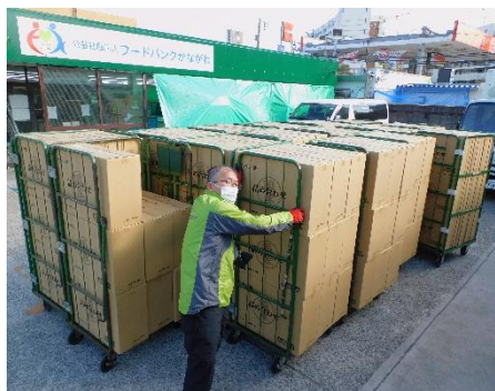
生活クラブ神奈川の「おふくわけ※」で届いたノンカップ麺 詰合せ(※組合員が注文した食材がフードバンクに届き、食べものを必要としている人のために活用されるしくみ)