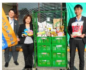
中央労働金庫 全体幹事会 様