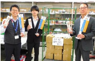
神奈川県のち・未来戦略本部 様 ※神奈川県観光協会様よりご寄贈の蕎麦の運搬と合わせ、フードバンク倉庫の視察をされました。