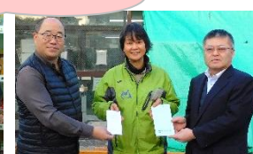
川崎労働者福祉協議会 様(左) 横浜労働者福祉協議会 様(右)