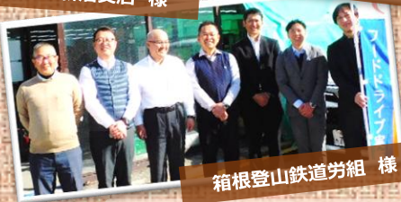
箱根登山鉄道労組 様