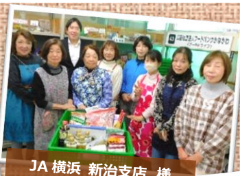
JA 横浜 新治支店 様