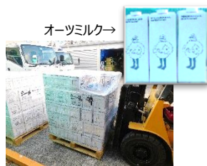
インプロセス(株) 様