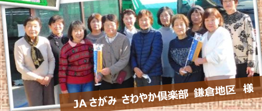
JA さがみ さわやか倶楽部 鎌倉地区 様

ほか 定期的に支援に来てくださっている団体の皆さま(浜っ子南、神奈川フードバンク・プラス、奉仕大好きグループ)、仕分け体験グループの支援をくださった個人ボランティアの皆さま いつもありがとうございます!