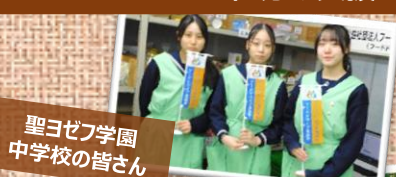
聖ヨゼフ学園 中学校の皆さん