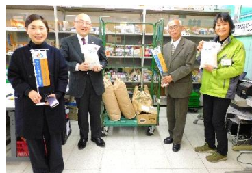
横浜ベイシェラトンホテル&タワーズ 様