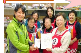
JA 横浜 女性部 様