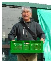
JP 労組横浜西支部 様