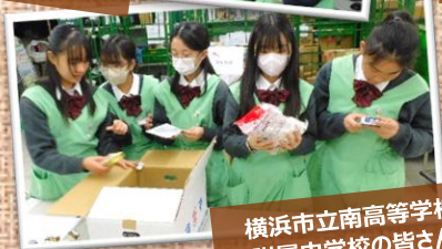
横浜市立南高等学校 附属中学校の皆さん