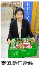
京浜急行電鉄(株) 様