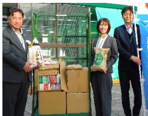
こくみん共済 coop 様