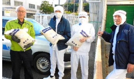
横浜総合パン(株) 様