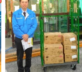
孝道山 本仏殿 様