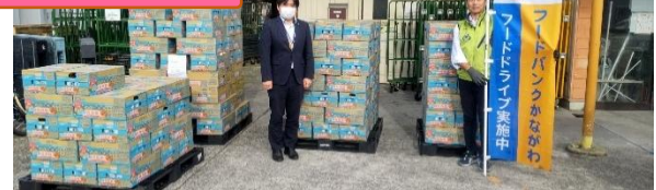
日本コプ共済生活協同組合連合会 様