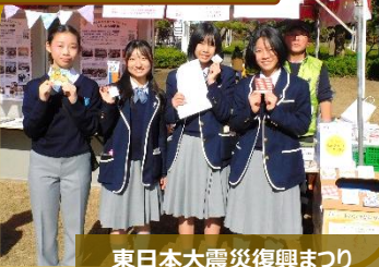
東日本大震災復興まつり