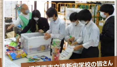
相模原市立清新中学校の皆さん

その他 定期的に支援に来てくださっている団体の皆さま（浜子南、神奈川フードバンク・プラス、フードバンク横浜、子どもフリースペースいらっやい、奉仕大好きグループ）、仕分け体験グループの支援をしてくださった個人ボランティアの皆さま いつもありがとうございます！