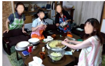
こども広場での学習支援後、みんなで一緒に軽食を作って楽しんでいます。