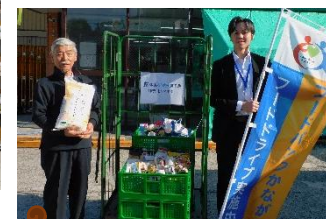
←ろくみ友の会 神奈川地区本部 様