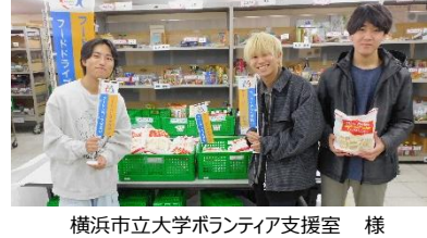
横浜市立大学ボランティア支援室 様