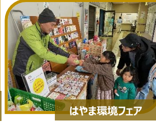
はやま環境フェア