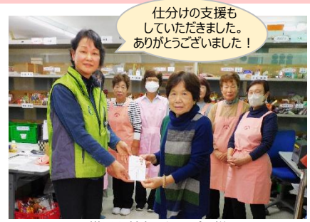
JA 横浜女性部カトリア会 様