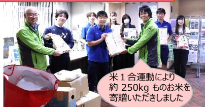
横浜 YMCA 様