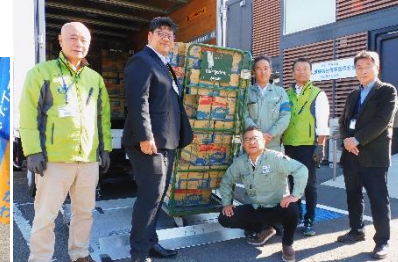
住友重機械労働組合連合会 様