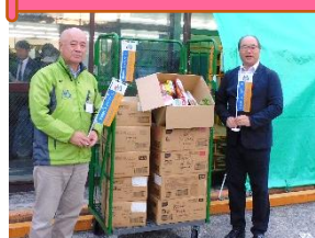
川崎労働者福祉協議会 様