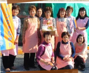
JA 横浜たすけあい 様