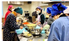
全員ボランティアでの運営