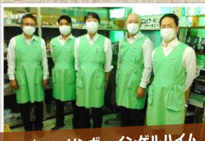
日本ベリンガーインゲルハイム 様