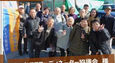
とつかエココーディネーター協議会 様