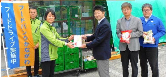
JAM 神奈川 様