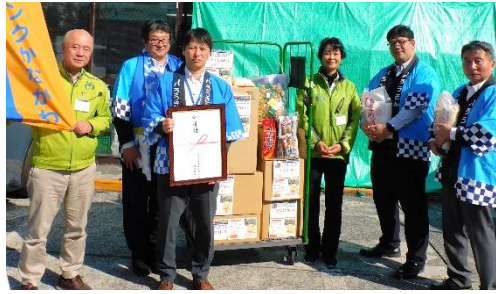
三浦半島労働者福祉協議会／中央労働金庫横須賀支店 様