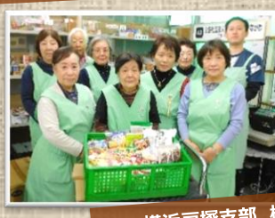
JA 横浜戸塚支部 様