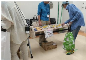
テーブルに食品を種類別に並べ、セルフで選ぶスタイル。また食堂ではカレーも提供もしています