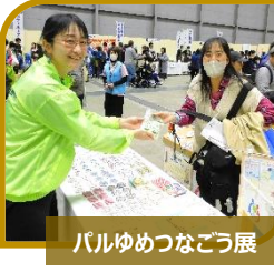
パルめつなごう展