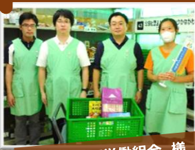
キョクシア労働組合 様