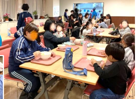
ケアプラザ多目的ホールで大勢でカレーを食べ、食後は折り紙などで遊びました。