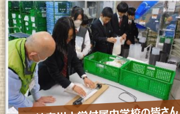
神奈川大学附属中学校の皆さん