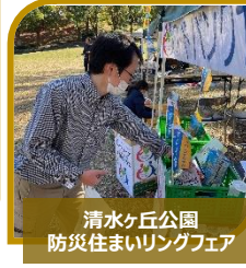
清水ヶ丘公園 防災住まいリングフェア