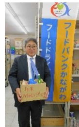
神奈川県高等学校 教職員組合 様