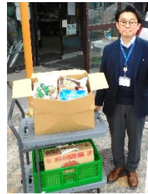
中央労金鶴見支店 推進幹事会 様