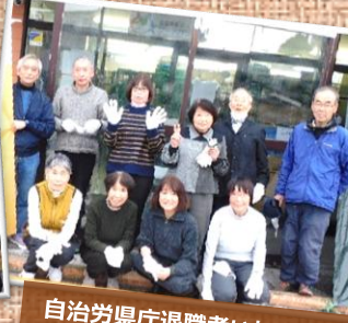
自治労県庁退職者いちょう会様