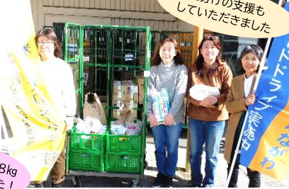
ユコープ 湘南2エリア会様