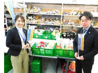
神奈川トヨタ自動車(株) 様