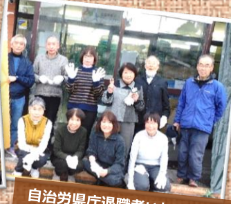
自治労県庁退職者いちょう会様