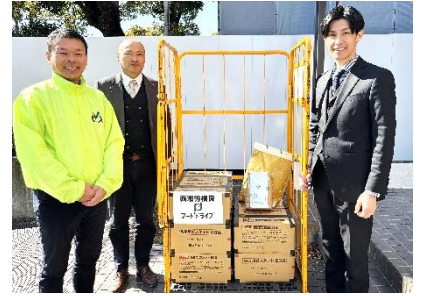
西湘労働者福祉協議会 様