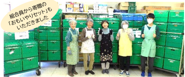
パルシステム神奈川 宅配12センター フードドライブ