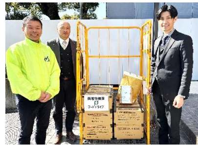
西湘労働者福祉協議会 様