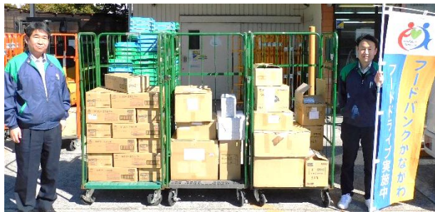
住友重機械工業(株) 様