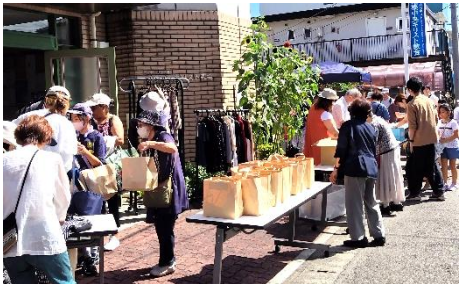
相模中央キリスト教会：年3回食品無料配布デーを実施。この日は約50名の方が受け取りにいられました。

個人や企業・団体から寄贈いただいている食品は、利用登録団体でどのように活用されているでしょうか。今号より、各団体からいただいた写真で、現場での活用状況をご紹介します。