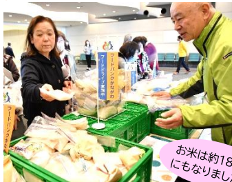
JA 横浜様 女性部大会にて