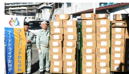
葉山町 様 ほか