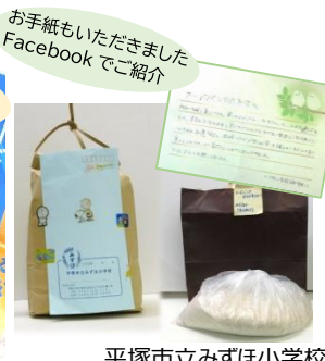
平塚市立みずほ小学校 5年3組・4組様