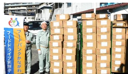
葉山町 様 ほか