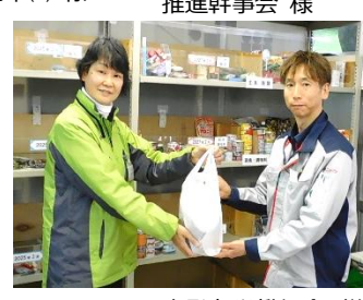
日本発条労働組合 様