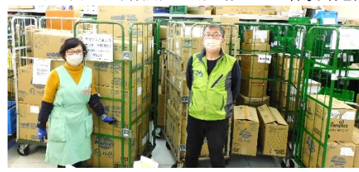
生活クラブ生協 宅配9センター フードドライブ