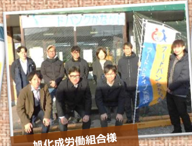
旭化成労働組合様