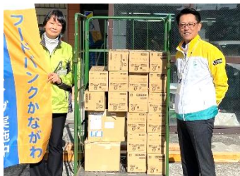
明治安田生命保険相互会社 様