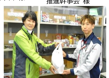
日本発条労働組合 様