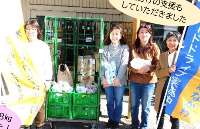
ユコープ 湘南2エリア会様