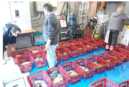
チームやどりぎ：月1回のフードパントリー準備の様子。障がいがあり、日々食料を必要としている利用者も多い状況です。