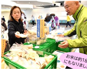
JA 横浜様 女性部大会にて