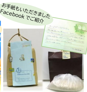
平塚市立みずほ小学校 5年3組・4組様