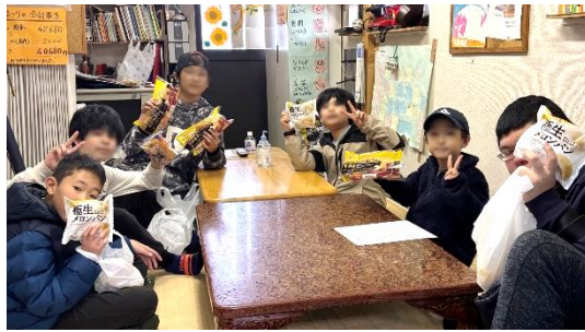
横浜みどりの学校ひまわり：学習支援・ソーシャルスキル指導・居場所の提供をしています。参加した子供たちへパンを配布している様子です。