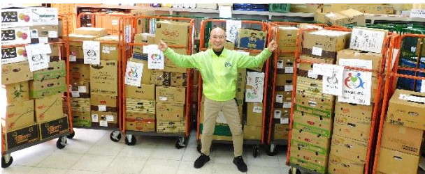
ユコープ 冬の全63店舗 フードドライブ