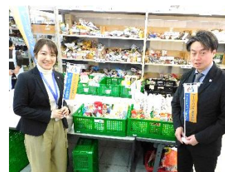
神奈川トヨタ自動車(株) 様