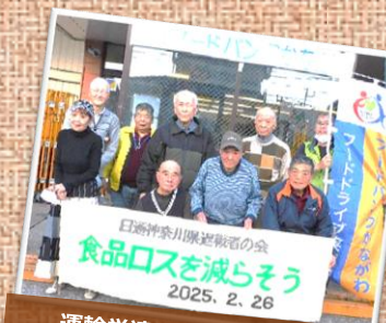
運輸労連（退職者の会）様