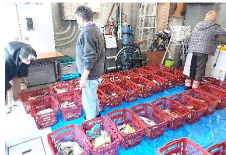
チームやどりぎ：月1回のフードパントリー準備の様子。障がいがあり、日々食料を必要としている利用者も多い状況です。