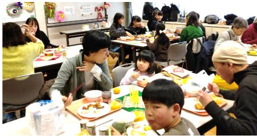
長後みんなのおうち食堂：高齢者から子どもまで誰でも気軽に来れる食堂の様子です。当日は108人が参加しました。