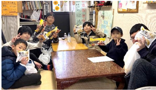
横浜みどりの学校ひまわり：学習支援・ソーシャルスキル指導・居場所の提供をしています。参加した子供たちへパンを配布している様子です。