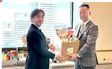
ユコープ×(株)横浜銀行 様