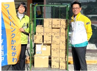
明治安田生命保険相互会社 様