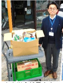
中央労金鶴見支店 推進幹事会 様