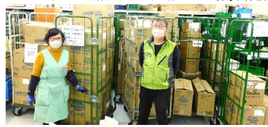
生活クラブ生協 宅配9センター フードドライブ