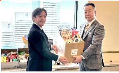
ユコープ×(株)横浜銀行 様