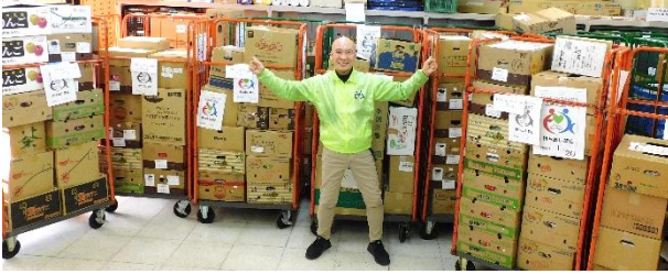
ユコープ 冬の全63店舗 フードドライブ