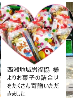
西湘地域労福協 様 よりお菓子の詰合せ をたくさん寄贈いただき ました