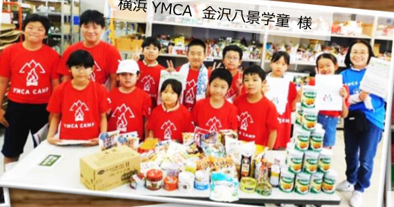
横浜 YMCA 金沢八景学童 様