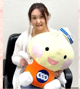
マスコットのユニオニオンと

そのときに、フードバンクかながわの活動を知っていたら、子どもたちの学びはさらに深まり、自分たちが住む神奈川県に目を向けることが出来ていたのではないだろうかと考えます。これから、フードバンクかながわで取り組んでいる学習会を広めながら、地域の「たすけあい」「支え合い」「分かち合い」を広めていきたいと思います。