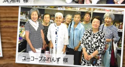
ユークラブふれんず 様