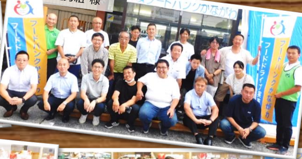
私鉄江ノ電労組 様