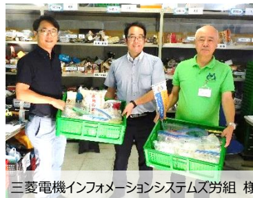
三菱電機インフォメーションシステムズ労組 様