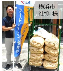
横浜市 社協 様