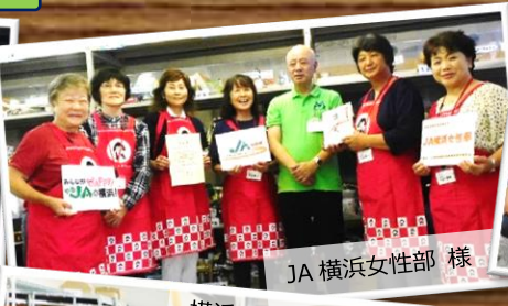
JA 横浜女性部 様