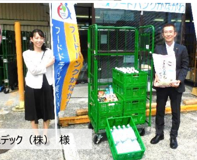
ニデック (株) 様