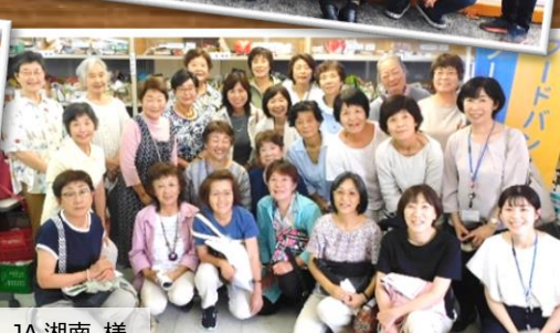
JA 湘南 様