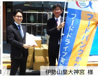
伊勢山皇大神宮 様