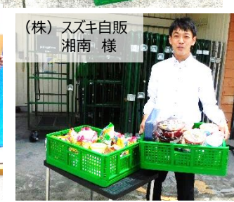
(株) ススキ自販 湘南 様