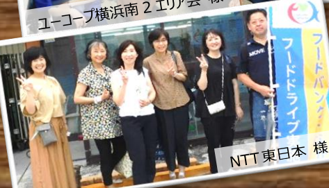
NTT 東日本 様