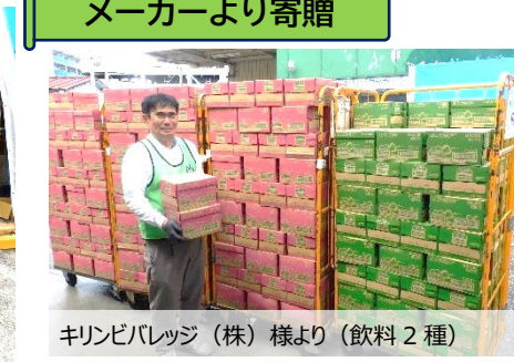
キリンビバレッジ (株) 様より (飲料2種)