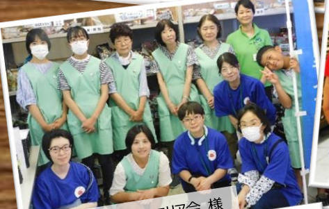
ユークラブ横浜南2エリア会 様