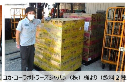
コカ・コーラボトラーズジャパン (株) 様より (飲料2種)