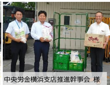
中央労金横浜支店推進幹事会 様