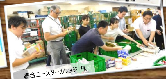
連合ユースターカレッジ 様