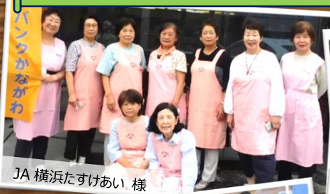
JA 横浜たすけあい 様