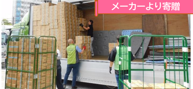
三菱商事ライフサイエンス (株) 様 (フリーズドライのスープ・味噌汁)