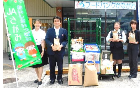
JA さがみ 地域ふれあい課 様