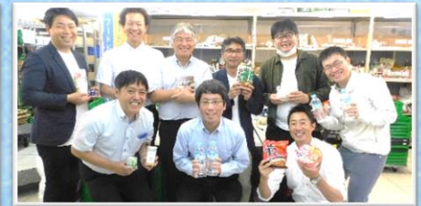
パナソニックオートモーティブ労働組合 様