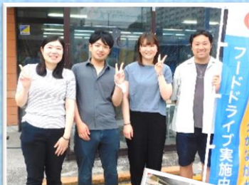
まいばすけっと 労働組合様