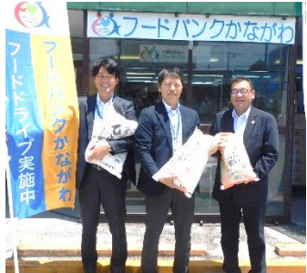
中央労働金庫 杉田支店 様

お米が継続的に大変不足しています。多くの団体、個人の皆さまからのお米の寄贈が本当にありがたく、お礼を申し上げます。