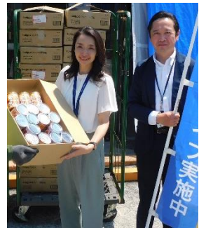
神奈川スバル(株) 様