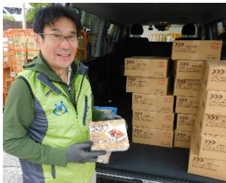
(株)相鉄ビルメンテナンス 様