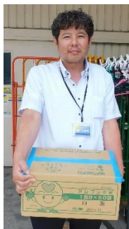
日新産業 (株) 様