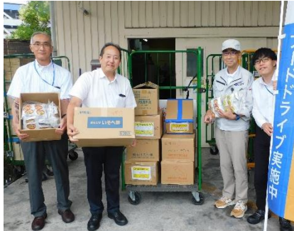
みなとみらい二十一熱供給 (株) 様