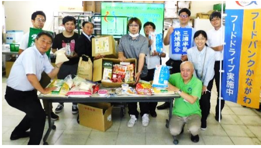
三浦半島地域労働者福祉協議会 様