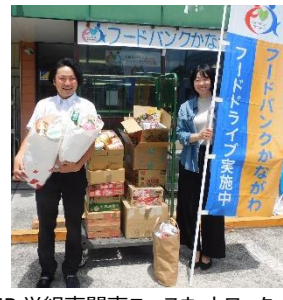
JP 労組南関東ユースネットワーク 様