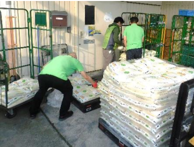
生活クラブ生協 組合員の支援活動「おふくわけ」