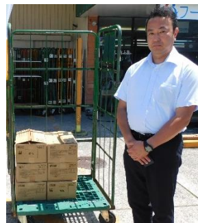
東芝労働組合京浜支部 様