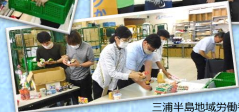
三浦半島地域労働者福祉協議会 様