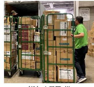
(株) 山星屋 様