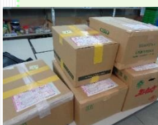
横浜北生活クラブ大丸デポーから宅配

フードバンク通信も今後、地域生協のリーダー層にも配布する予定で、ますますフードバンク活動への理解と共感が広がってほしいと思っています。