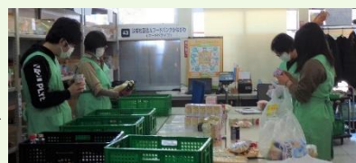
ボランティア参加も