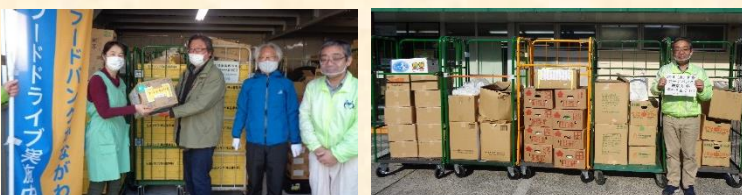
上・左：生活クラブのフードドライブの一部。下右：福祉クラブ