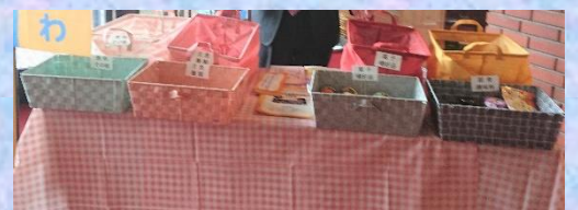
フードドライブグッズをリニューアル