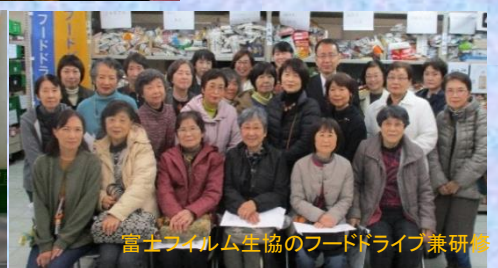
富士フィルム生協のフードドライブ兼研修

3生協のフードドライブ報告(4/1-11/29) 23,685個 6,961kg