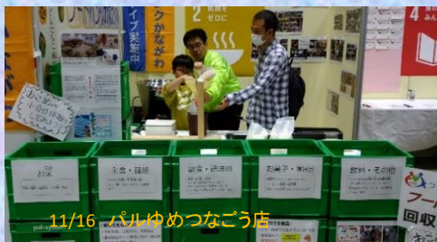
11/16 パルゆめつなごう店