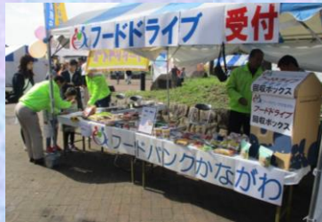
川崎市民と働く者の フェスタ。55.5kg