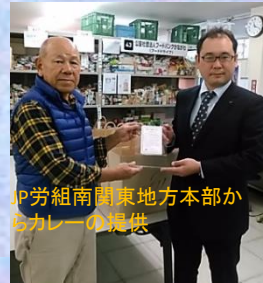
IP労組南関東地方本部か りカレーの提供