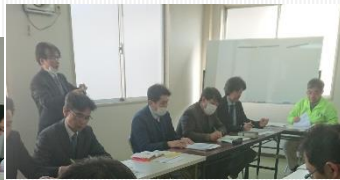
左:フードバンク小田原の方々。 右:小田原市の各部署の方々。

ユーコープ小田原センターが西湘エリアの中継拠点となり、フードバンクかながわの中継拠点が6か所となりました。